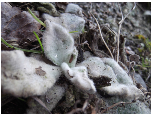
Fig. 4. Vraatschade 1-vii. 2009

Fig 1-4: Nothris verbascella op Verbascum densiflorum te Bloedbergduin, (provincie Zuid-Holland).