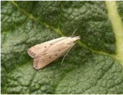
Fig. 5. Perizoma albulata , ratelaarspanner.