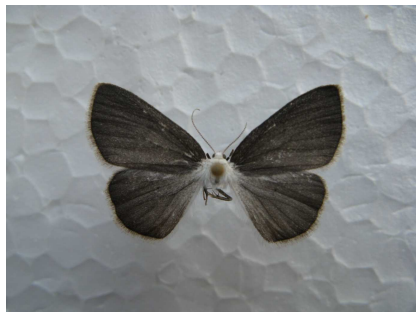
Fig. 7. Cabera pusaria f. heyeriana