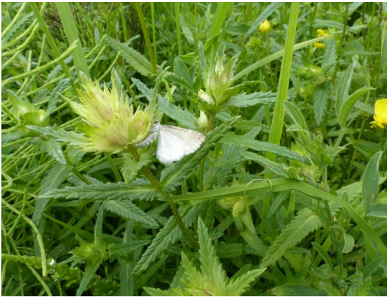
Fig. 6. Perizoma albulata , ratelaarspanner.