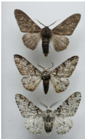
Fig. 8. Biston betularia , Boven: donkere variant. Onder: lichte variant.