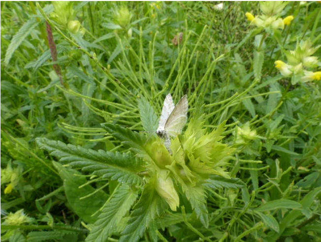
Fig. 1. Adult ex larva Nothris verbascella 15.iii. 2012 uitgekweekt op 30.v.2012