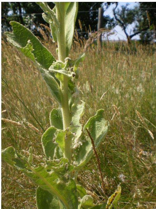
Fig. 3. oudere rups Nothris verbascella op vii.2011