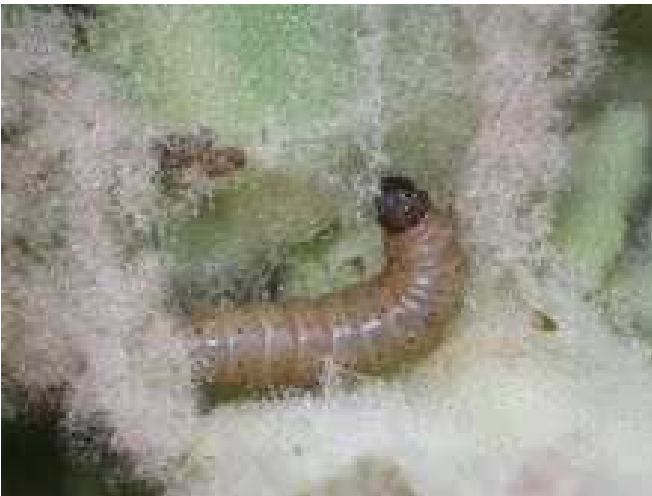
Fig. 2. Juvenile rups N. verbascella op 26.ii.2013.