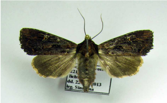
Fig. 4. Apamea aquila Donzel