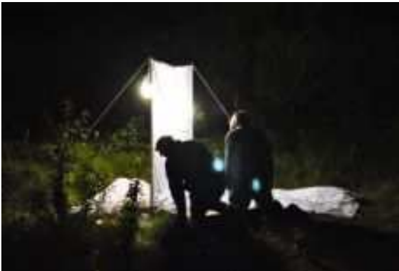
Fig. 5. Inspectie van de oogst op het laken tijdens de Ter Haar en Snellen excursie.