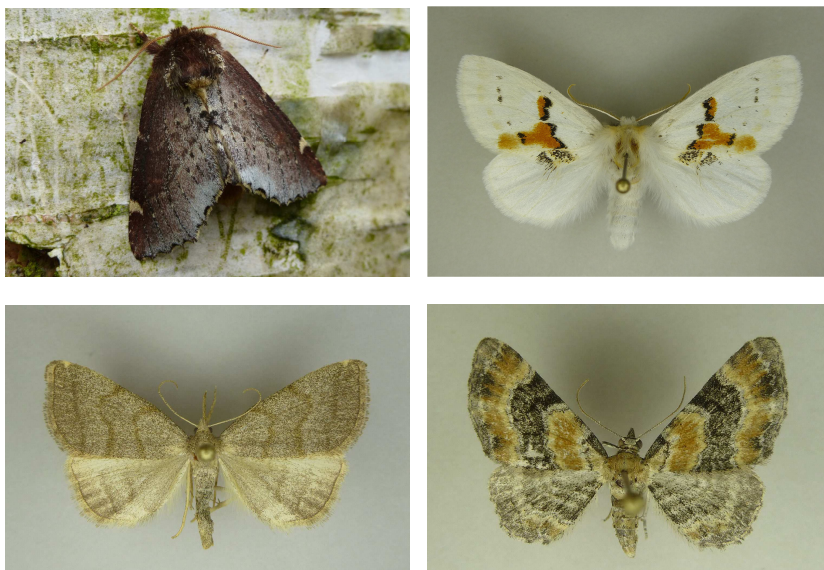
Fig. 2.

Links boven: Odontosia carmelita , Beetsterzwaag, 25 april 2013.