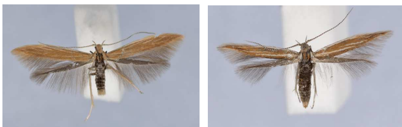
Fig. 3. Links: Coleophora bornicensis . Rechts: Coleophora saponariella

Rechts onder: Eupithecia pulchellata , Beetsterzwaag, 5 juni 2013.