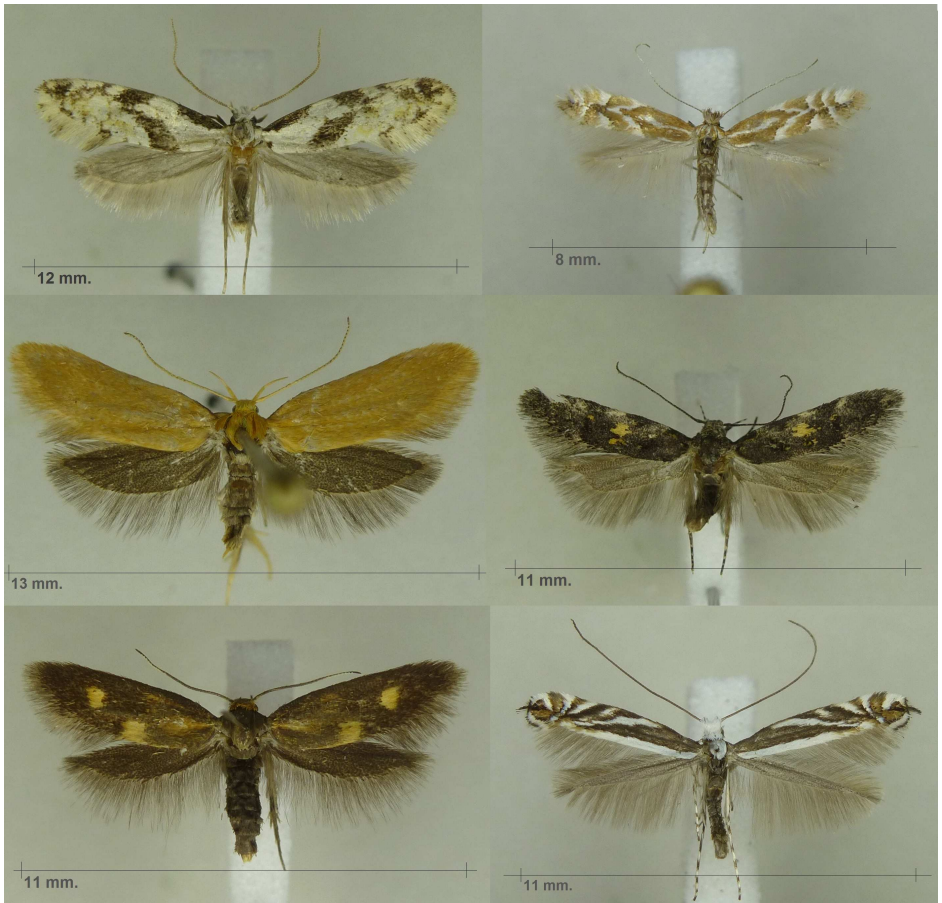
Fig. 1.

Links boven: Nemapogon clematella ; rechts boven: Phyllonorycter scopariella ;