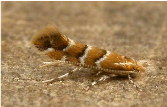
Fig. 6. Cameraria ohridella .